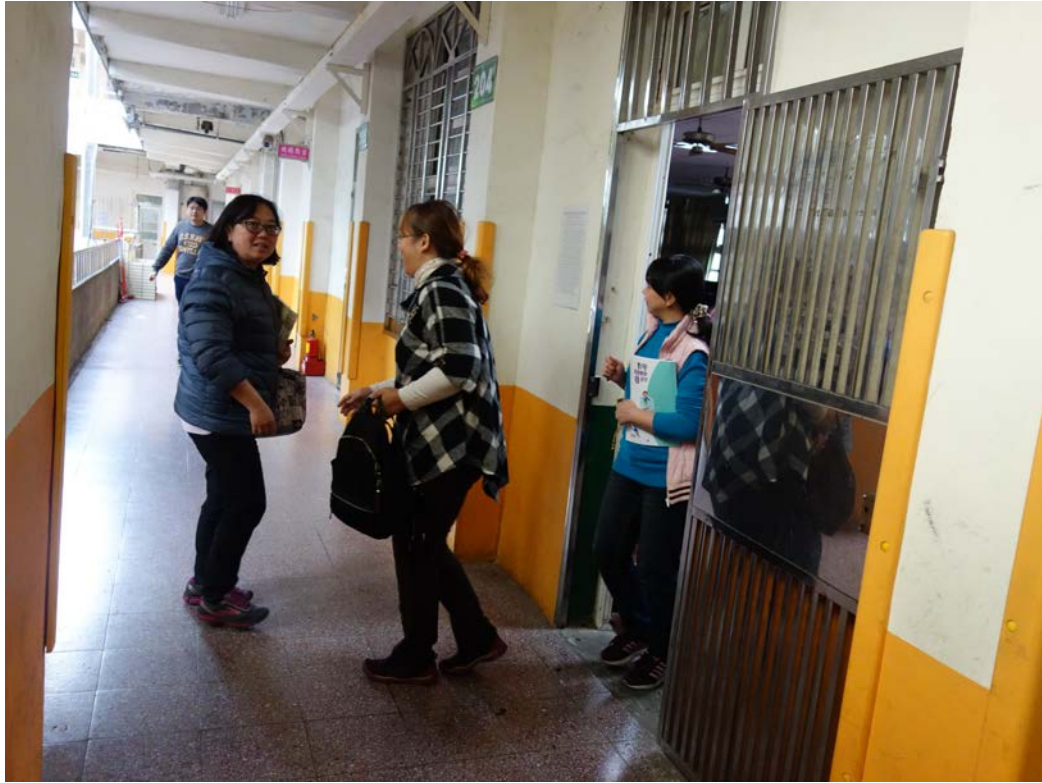
說明：避難引導演練