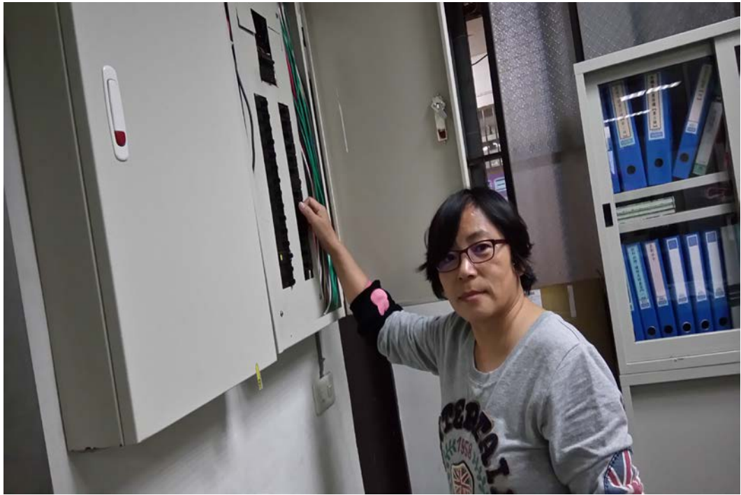
說明：安全防護訓練關閉電源