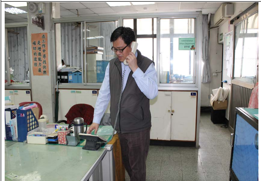
說明：確認火災、對外通報 119、對內廣播、通報情形