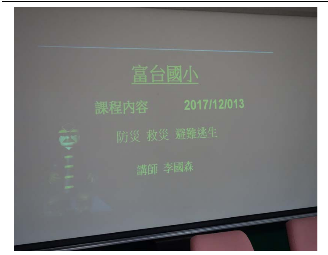
說明：消防安全防災防火課程