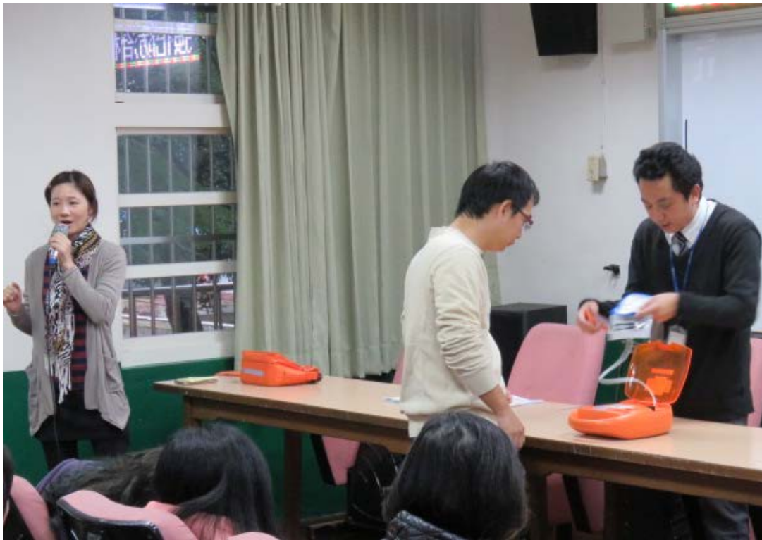
說明：緊急救護 AED 訓練