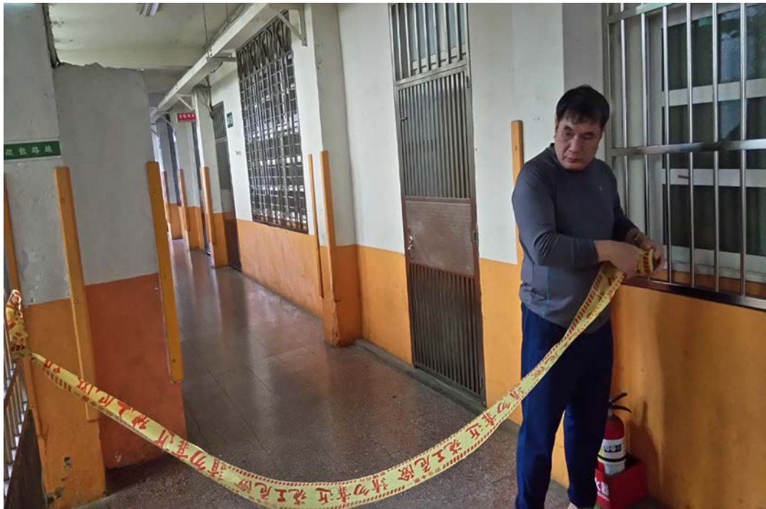
說明：安全防護劃定警戒區情形