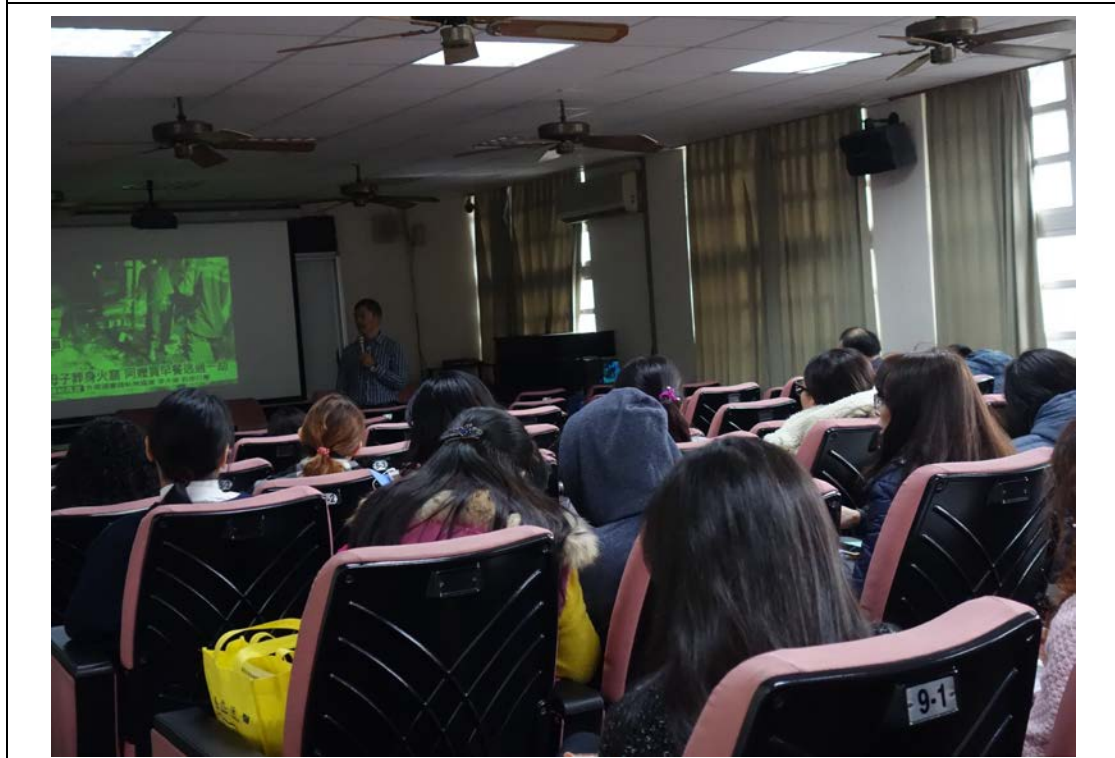
說明：消防安全防災防火課程說明