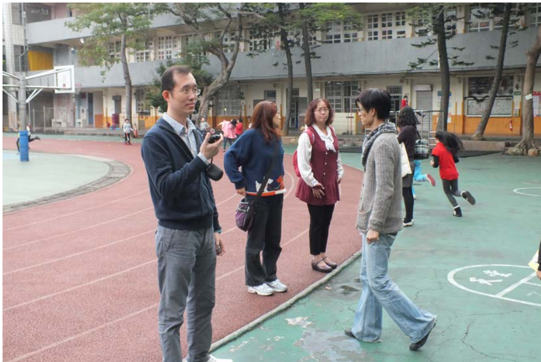
說明：避難引導演練至操場