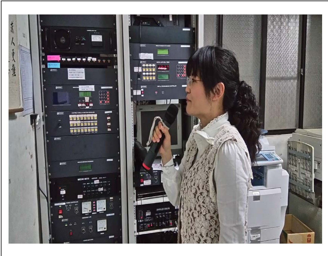
說明：緊急通報演練