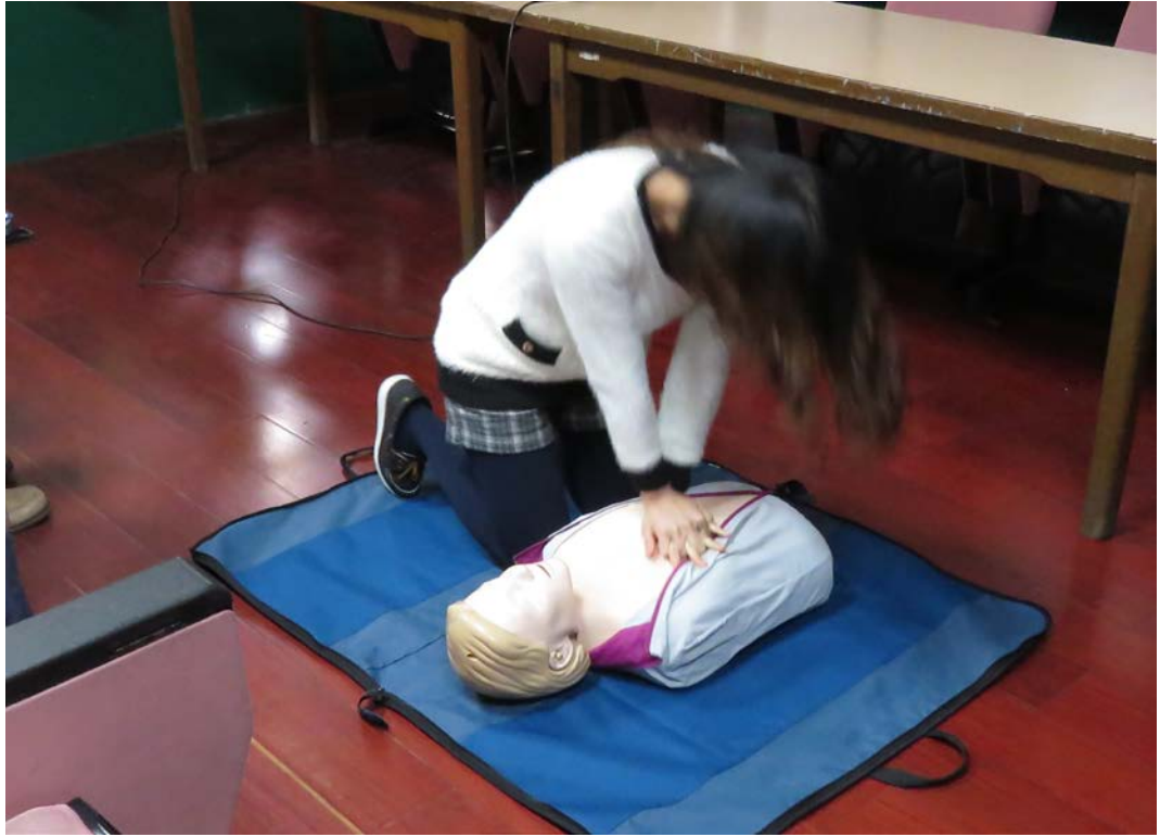
說明：緊急救護 CPR 訓練