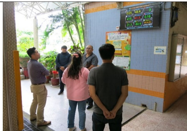
說明：軟體使用說明