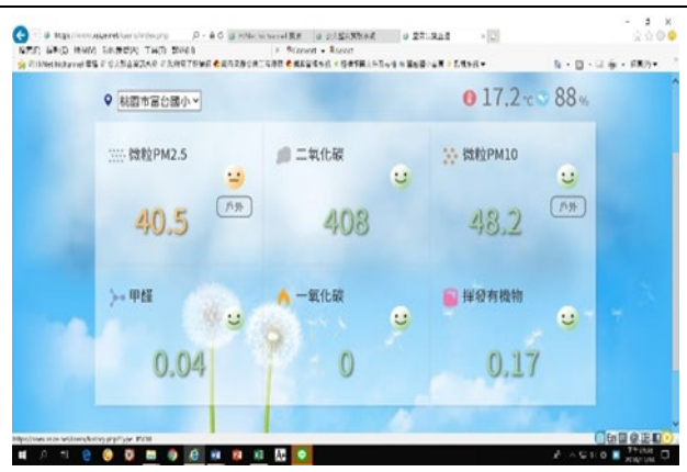
說明：軟體使用說明