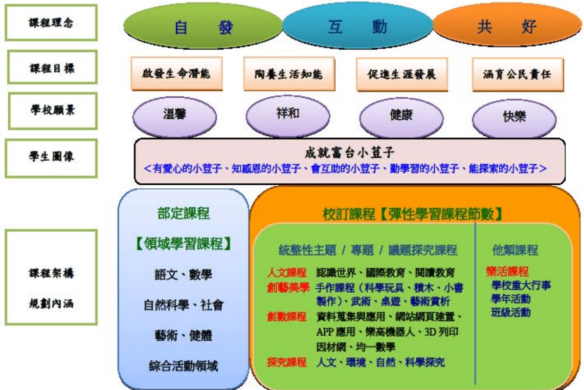
桃園市中壢區富台國民小學學校課程地圖